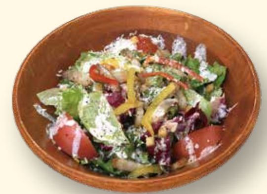
手作りベーコンのシーザーサラダ ¥880