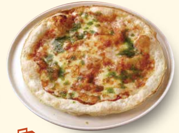
蔵王モッツァレラのマルゲリータピザ ¥980