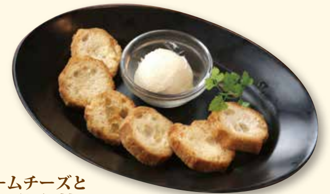
蔵王クリームチーズとサクサク仙台麩 ¥780