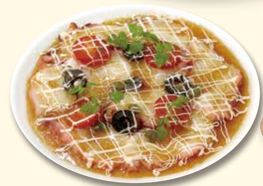
タコのカルパッチョ ¥880