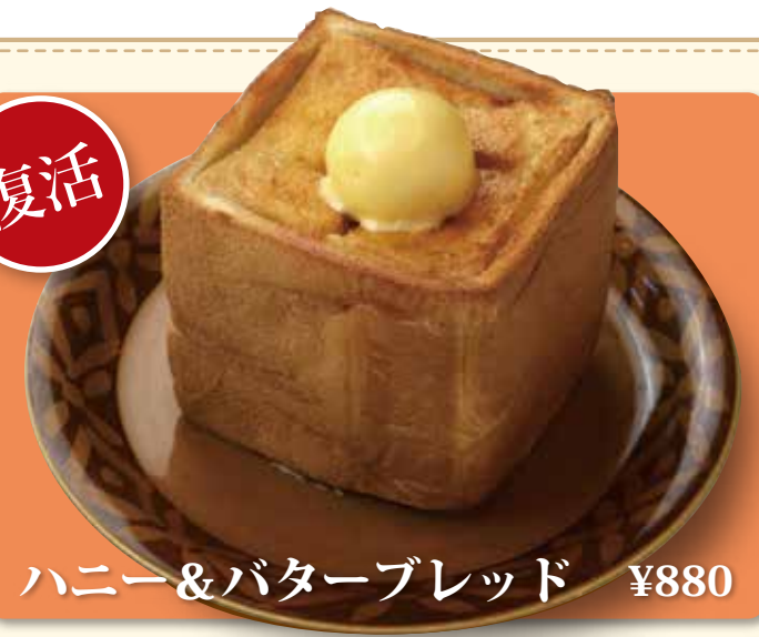
ハニー&バターブレッド ¥880