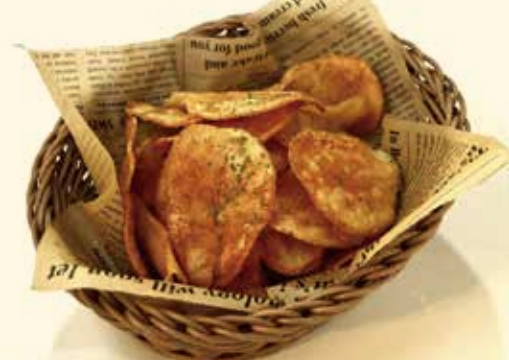
手作り揚げたてポテトチップス ¥680 【アボカド】【サルサ】2種のディップ付き

さくらのスモークウッドで 丁寧に香りを付けました。 ビールはもちろんハイボール にも良く合います