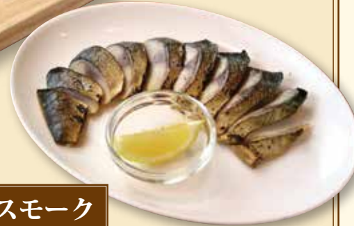
金華さばのスマーク ¥630

さくらのスモークウッドで 丁寧に香りを付けました。 ビールはもちろんハイボール にも良く合います