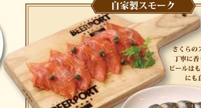
宮城県産銀鮭のスマーク ¥630