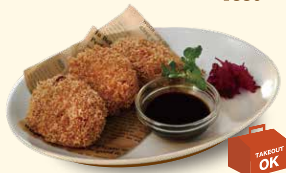
みやぎのポーク 「宮城野豚みのり」のメンチカツ ¥680