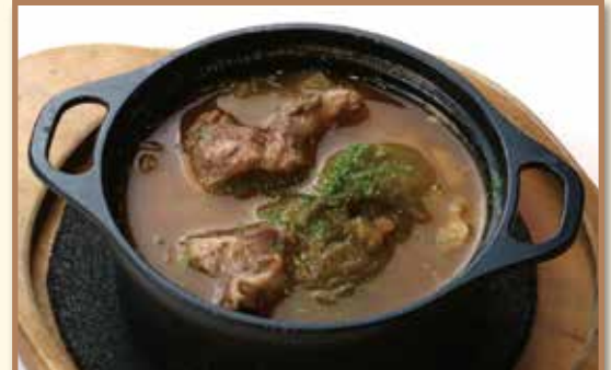
牛すじ肉のビール煮込み ¥880