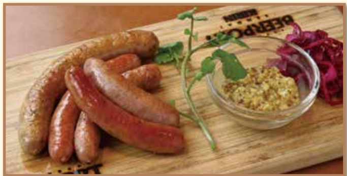
伊豆沼ソーセージ5種盛り 【フランク・粗びき・ハーブ・黒胡椒・チョリソー】 ¥1,380