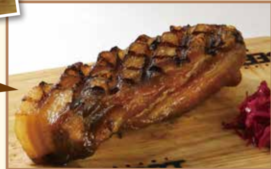
手作り厚切りベーコンのグリル ¥980