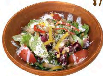
手作りベーコンの シーザーサラダ ¥880