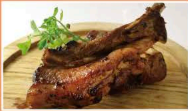
スペアリブ(一人前) ¥1,280