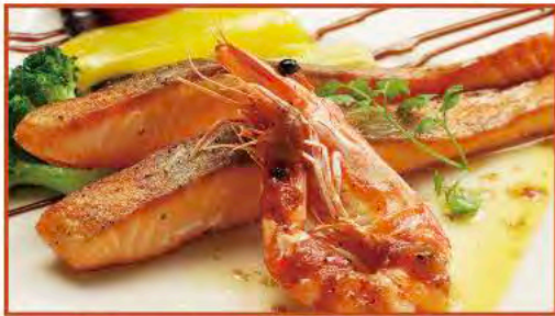
◆宮城県産銀鮭と海老のポワレ