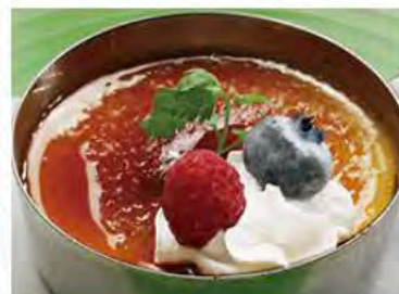
午後の紅茶のブリュレ