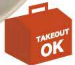
みやぎのポーク 「宮城野豚みのり」のメンチカツ ¥680