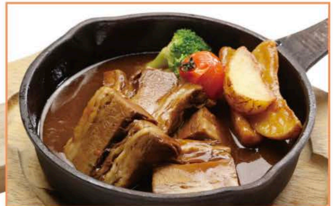
牛肉のビール煮込み ¥1,380