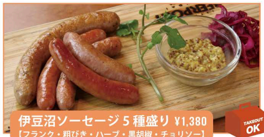
伊豆沼ソーセージ5種盛り ¥1,380 【フランク・粗びき・ハーブ・黒胡椒・チョリソー】