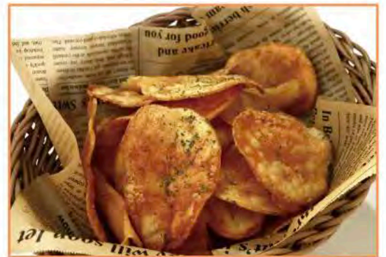
手作り揚げたてポテトチップス ¥680