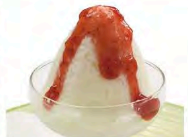
ソルティライチの 手作りシャーベット