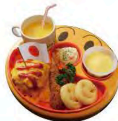
◆キッズオムライス ジュース付き ¥500