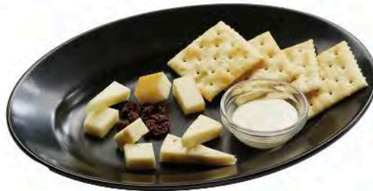
小岩井&蔵王チーズの 盛り合わせ ¥880