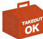
南三陸真鱈の フィッシュ&チップス ¥1,280