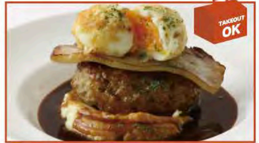
◆デミグラスソースと 自家製ベーコンのハンバーグ