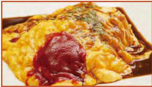
◆蔵王地養卵のふわとろオムライス デミソース&ケチャップ

※使用食材の仕入れ状況により産地や内容が変更になる場合がございます。変更がある場合はスタッフからご案内します。