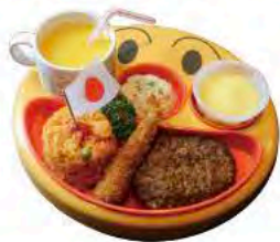
◆キッズハンバーグ ジュース付き ¥500