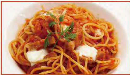
◆手作りベーコンと 蔵王モッツアレラのトマトパスタ