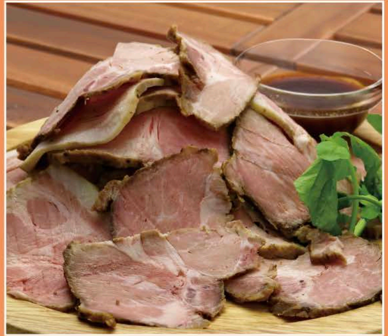
山盛り！ローストポーク