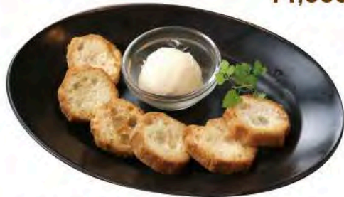
蔵王クリームチーズと サクサク仙台麩 ¥780