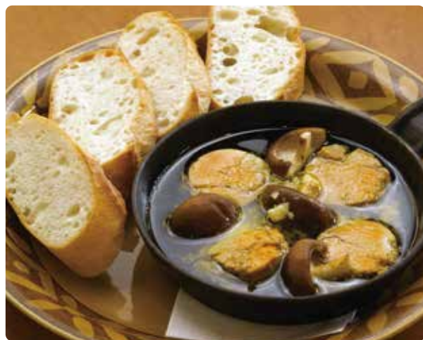
宮城県産 椎茸とあん肝のアヒージョ