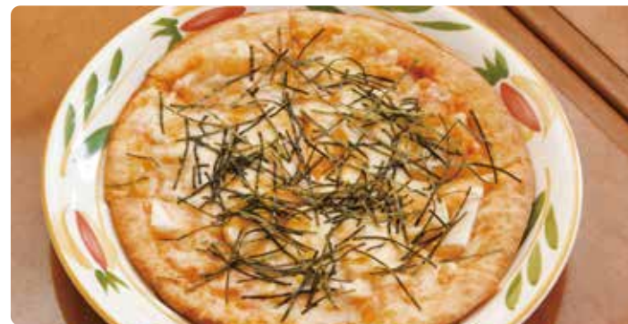
宮城県産海苔ともちの明太ピザ