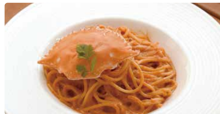
渡り蟹のスパゲッティ