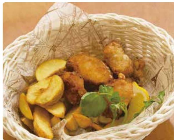
三陸産アンコウのフィッシュ&チップス