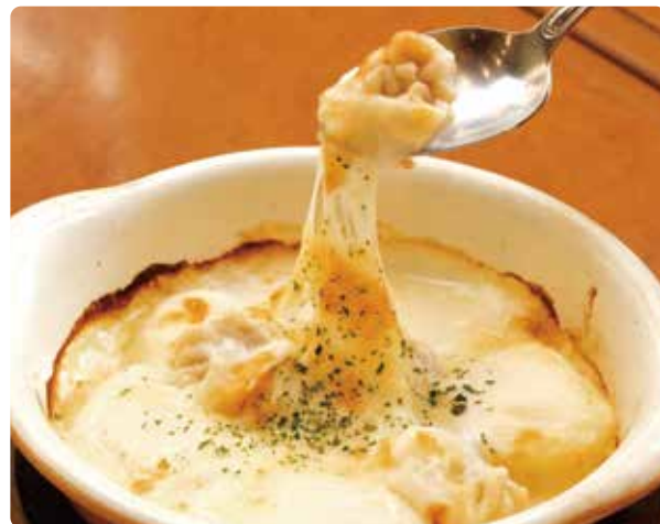
真鱈白子とじゃがいものグラタン