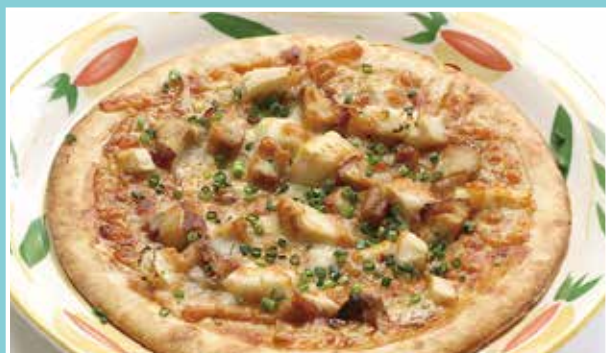
森林どりとタケノコの テリヤキピザ