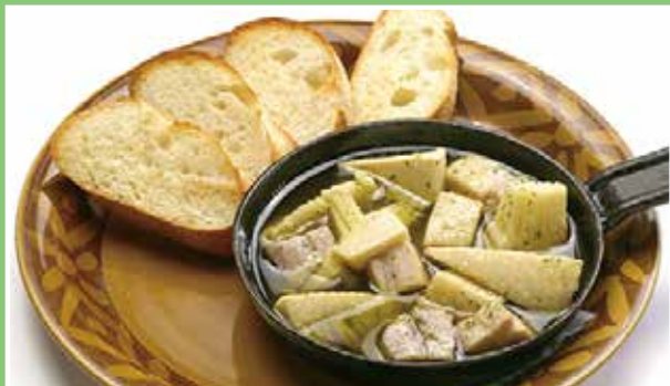
自家製ベーコンと タケノコのアヒージョ