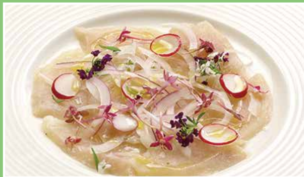
気仙沼メカジキハムと 新玉ねぎのカルパッチョ