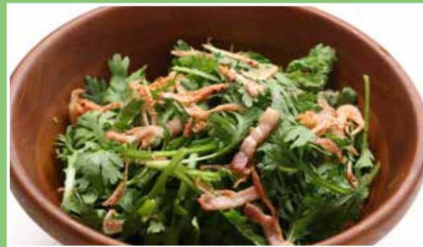
桜海老と春菊のサラダ 今野醸造 吟醸醤油のドレッシングで